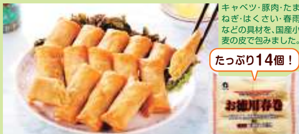
《ニッキーフーズ》所:神奈川

野菜(キャベツ、たまねぎ、はくさい)、豚肉、豚脂、植物油脂、はるさめ、しょうゆ、ポークエキス調味料、みりん、砂糖、食塩、香辛料、皮(小麦粉(小麦(国産))、食塩、ぶどう糖、植物油脂)/増粘剤(加工でん粉)、(一部に小麦・大豆・鶏肉・豚肉・ごまを含む)・賞:150日以上