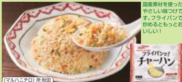
《マルハニチロ》所:秋田

米(国産)、野菜(ねぎ(国産)、にんじん)、鶏肉(国産)、鶏卵加工品、植物油脂(なたね油、ごま油、コーン油)、しょうゆ、みりん、チキンブイヨン、食塩、砂糖、ほたてエキス、おろししょうが、おろしにんにく、かきエキス調味料、酵母エキスパウダー、香辛料、酸味料、安定剤(加工でん粉)、(一部に小麦・卵・ごま・大豆・鶏肉を含む)・賞:240日以上