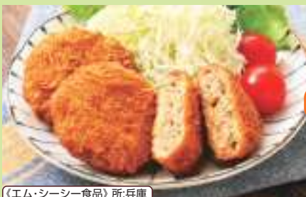
《エム・シーシー食品》所:兵庫

食肉(牛肉、豚肉、鶏肉)、ソテードオニオン(たまねぎ、ラード)(国内製造)、つなぎ(パン粉、全卵、でん粉)、粒状植物性たん白、牛脂、トマトケチャップ、砂糖、オニオンエキス、食塩、酵母エキス、脱脂粉乳、香辛料、衣(パン粉、小麦粉、砂糖、でん粉、なたね油、米粉)/加工デンプン、膨脹剤、(一部に小麦・卵・乳成分・牛肉・大豆・鶏肉・豚肉を含む)・賞:150日以上